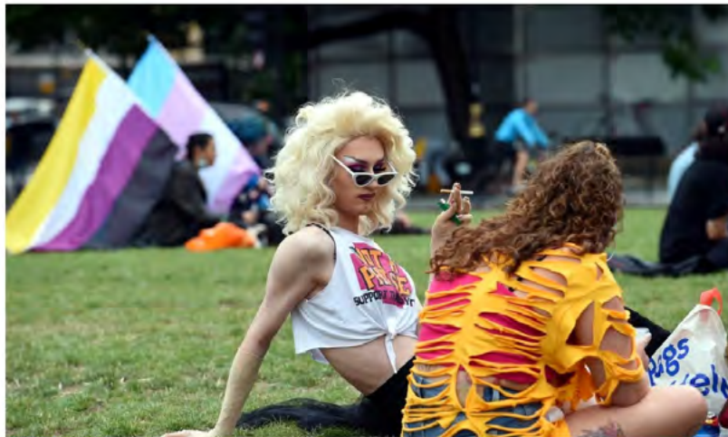
Protestas dėl translyčių teisių

✘ Renkantis iliustracijas iš LGBTIQ+ bendruomenės eitynių pirmiausia neišvengiamai daromos prielaidos dėl nuotraukose esančių žmonių tapatybės. Antra, kuriami realių patirčių spektro neatitinkantys translyčių asmenų vaizdiniai (asociacijos su ryškiu makiažu, specifine apranga ir aksesuarais). Neretai pasirenkamos tokios iliustracijos, kurios reprodukuoja tam tikrus stereotipus, pavyzdžiui, stereotipiškai „vyriškų“ bruožų turintis žmogus, apsirengęs ar pasidažęs stereotipiškai „moteriškai“.